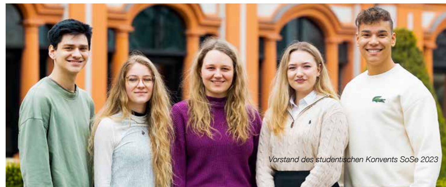
Vorstand des studentischen Konvents SoSe 2023