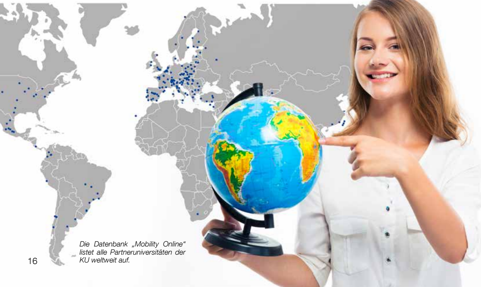
Die Datenbank „Mobility Online“ listet alle Partneruniversitäten der KU weltweit auf.