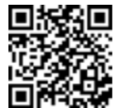
„geteduroam“ App für iOS