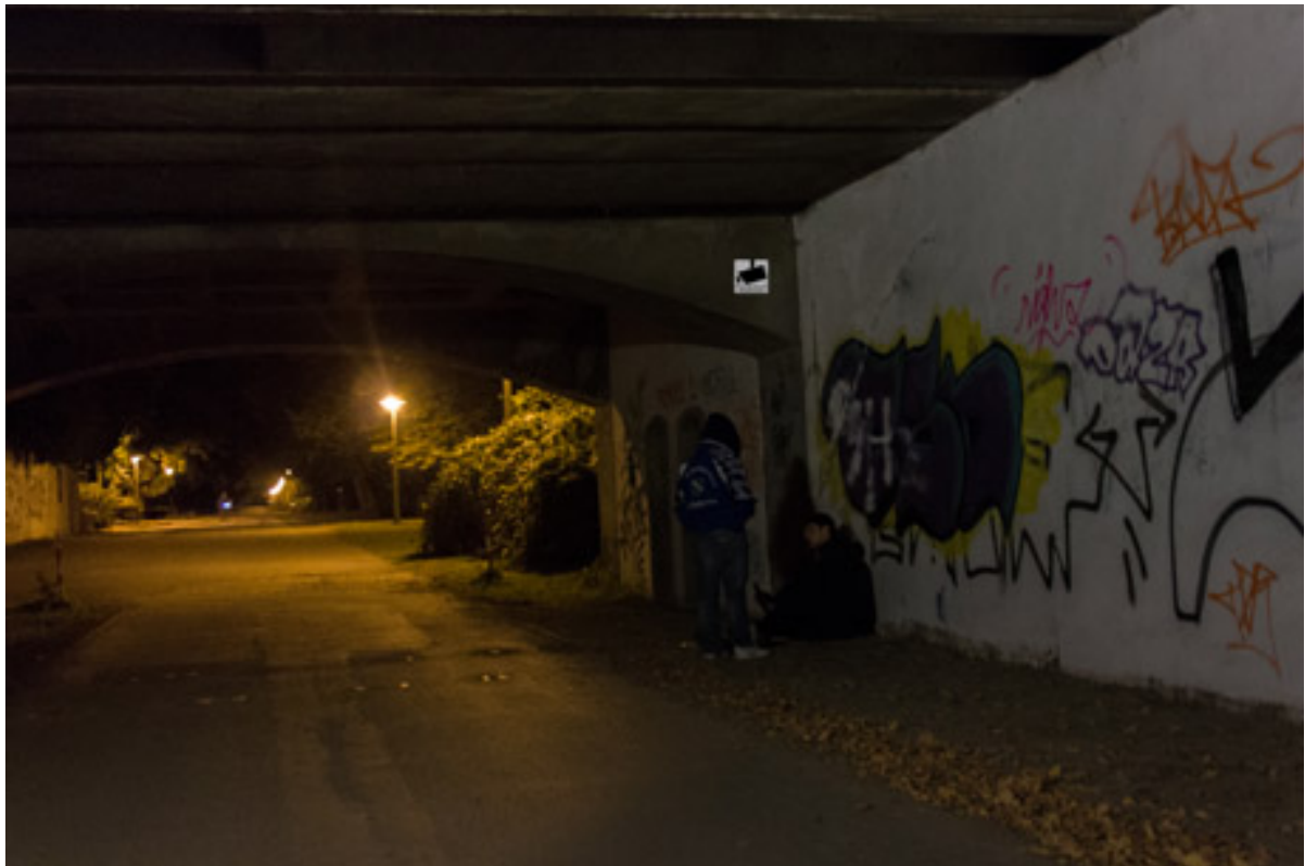
Abbildung 2: Visuelle Vignette

Die verbalen Vignetten dienten der Vorbereitung der Vignetten in visueller Form. Die Herstellung der Fotografien wurde mittels der Fließtexte angeleitet.